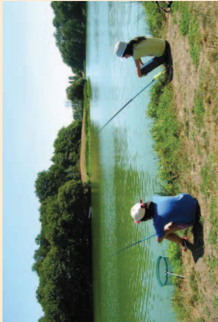
Les berges sont bien dégagées et permettent aux pêcheurs de s'installer confortablement pour des heures inoubliables.